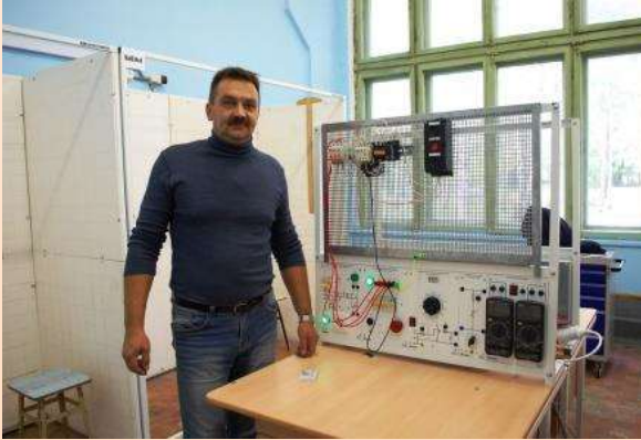
Фото с Конкурса профессионального мастерства